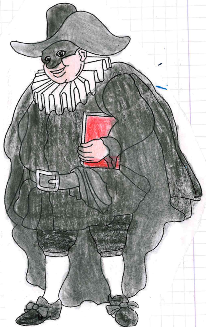
Balanzone (Emilia Romagna - Bologna)