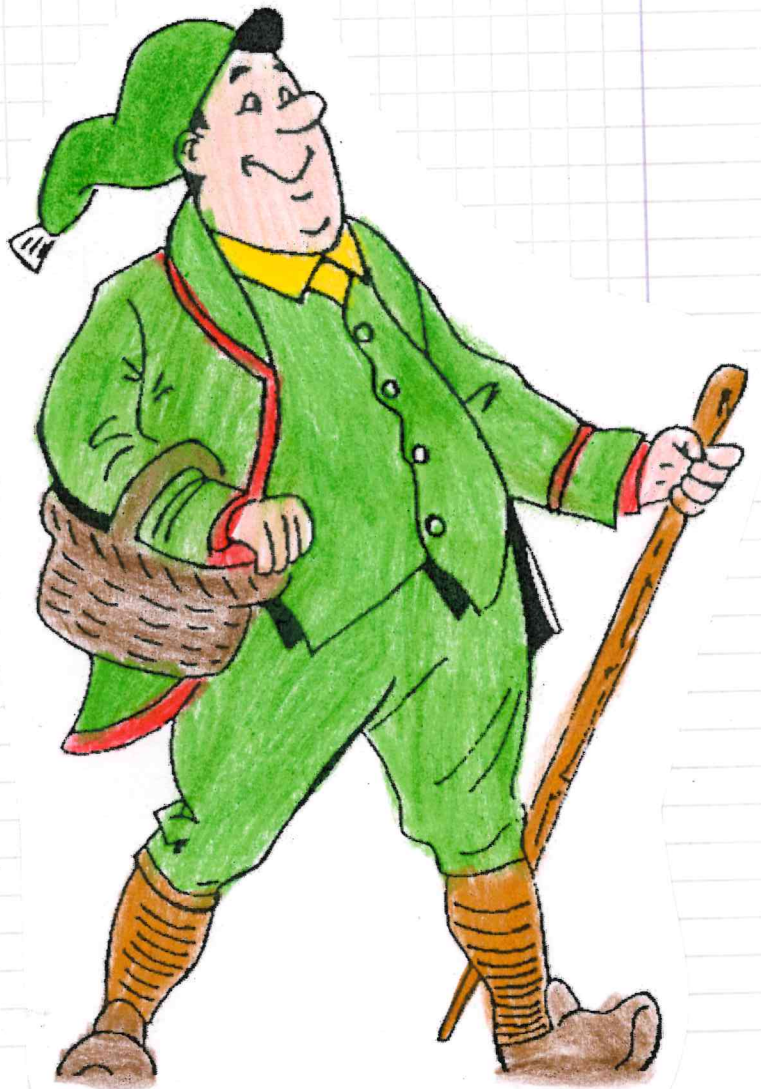
Giappino (Lombardia - Bergamo)