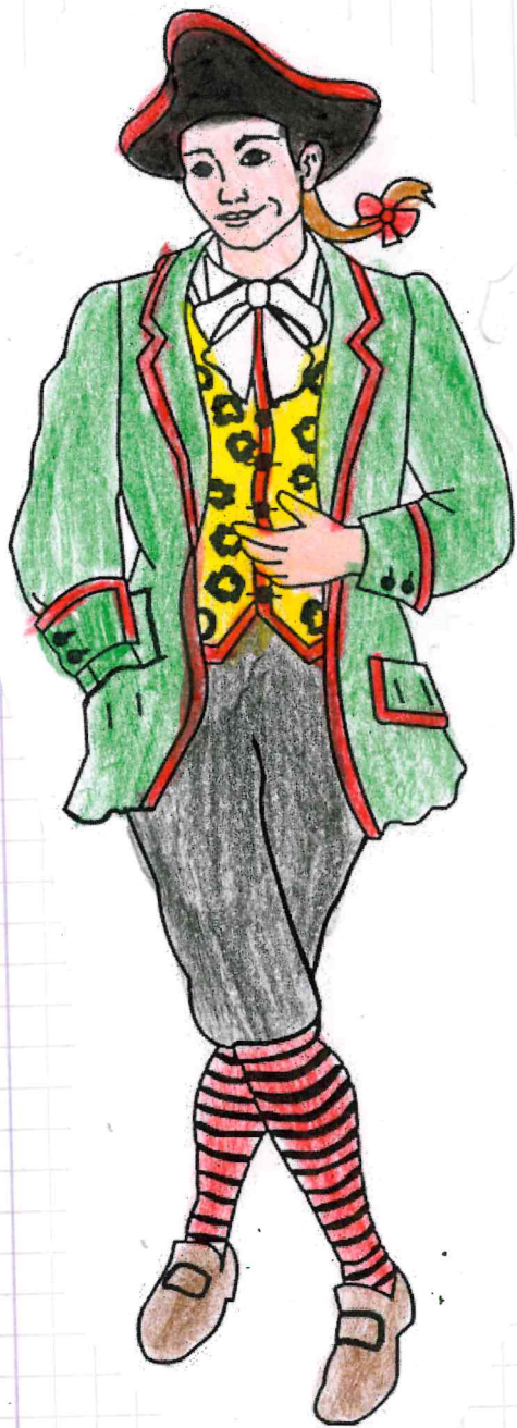
Meneghino (Lombardia - Milano)